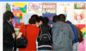
Expo de dessins, Paris, mai 2010

"Pour impliquer les élèves à travers un concours de création graphique et les responsabiliser pleinement en leur donnant la parole, en dessin et en écriture."