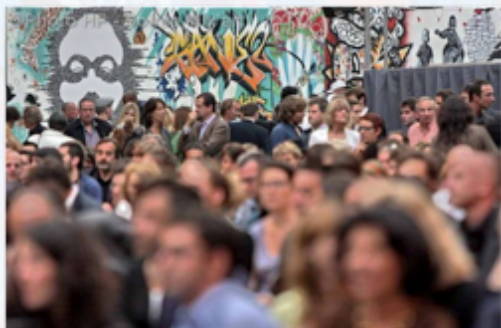
MIX'ART au Grand Palais, Paris, juin 2009

Lancée durant l'année scolaire 2009/2010 dans des classes pilotes de l'Académie de Créteil par l'association Ariana, l'opération MIX'ART, parrainée par M. Boutros Boutros Ghali, ancien Secrétaire Général de l'ONU, et inaugurée en 2009 au Grand Palais, ont touché cette année cinq Académies métropolitaines et outre-mer. Les quatre mille élèves des Académies de Créteil, Versailles, Nantes, Orléans-Tours et la Martinique ont pu s'initier aux formes les plus modernes d'expression de la culture urbaine, au graff et à la BD pour illustrer à leur manière la promotion de la Diversité et de la lutte contre les discriminations à l'école.