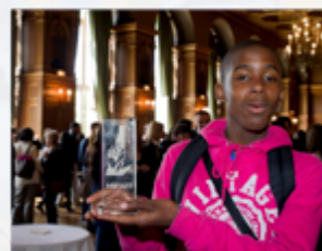
Jeune Lauréat, Paris, mai 2010

Les trophées sont remis aux classes lauréates par les partenaires institutionnels, les partenaires publics et privés, et des grands acteurs de la Diversité Culturelle impliqués dans le domaine de la promotion de l'égalité des chances et de la cohésion sociale, valorisant ainsi l'implication des élèves et de leurs enseignants.