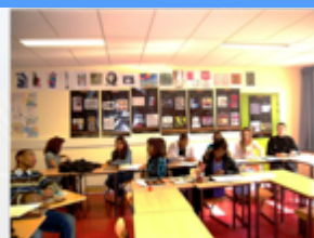
Atelier Mix'Art, Académie de Créteil

"Pour permettre aux collégiens et lycéens d'échanger et de s'enrichir aux côtés des artistes"