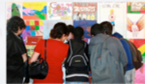
Expo de dessins, Paris, mai 2010

Présélection des productions : Afin de les impliquer pleinement dans l'opération, les élèves sélectionnent eux-mêmes 4 productions qui représenteront leur classe. Leurs facultés d'observation, de jugement ou d'appréciation sont ainsi mises en jeu : il s'agit d'une étape cruciale dans la reconnaissance et la valorisation des élèves et de leur travail.