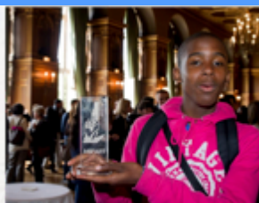
Jeune Lauréat, Paris, mai 2010

"Pour rendre hommage à l'implication des élèves et de leurs enseignants dans cette expression de la diversité."